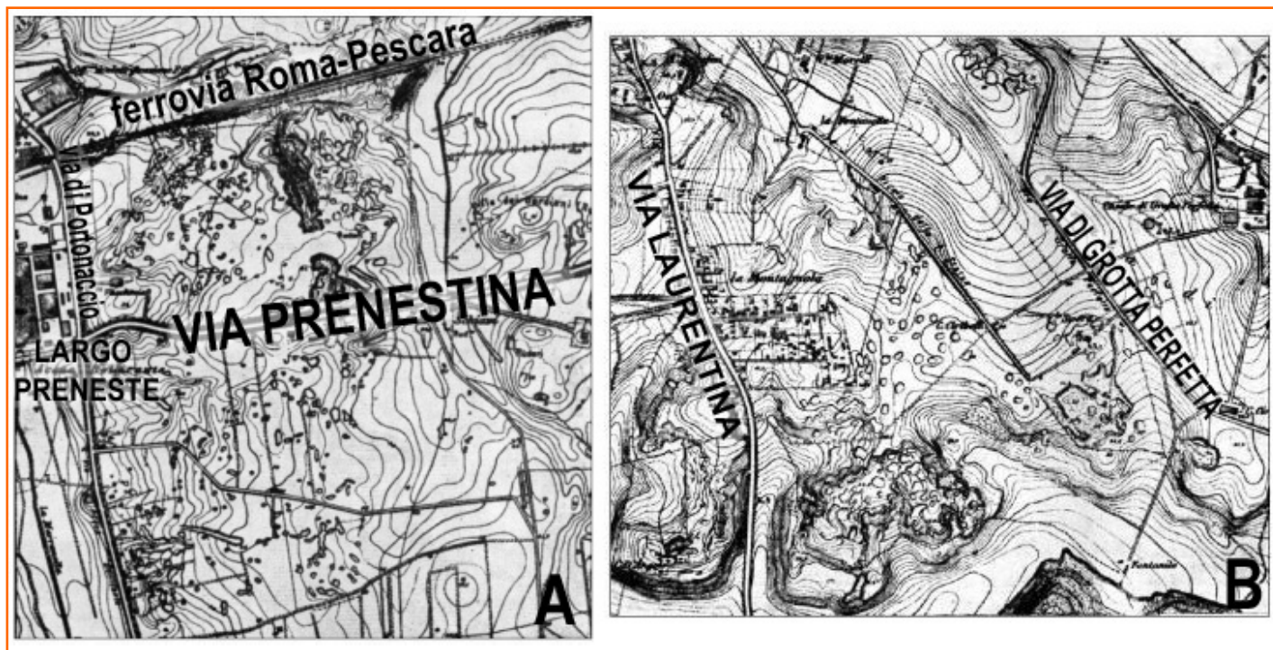
Figura 4. Carte topografiche del 1924, sono evidenti i dissesti in superficie dovuti alle cavità sotterranee, ormai non più visibili perché le zone sono intensamente urbanizzate [Ventriglia, 2002 - modificate]. A: zona tra Largo Preneste e Villa Gordiani. B: zona tra via Laurentina e via di Grotta Perfetta.

A breve sarà pubblicato uno studio molto interessante condotto nel Municipio VI da un'equipe dell'Università "Roma Tre"